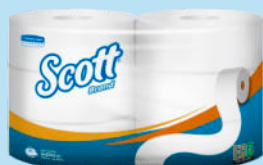
Pap. Hig. SCOTT® JRT 1P 6X1 X550