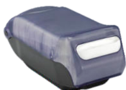
Disp. Servilleta MEGA IN-SIGHT* Mostrador Dispensada 1 a 1

Plancha 16 paq. x 400 und. Cod. 30162105