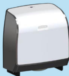
KCP DISP MOD BATH TISSUE JRT W/B ABS