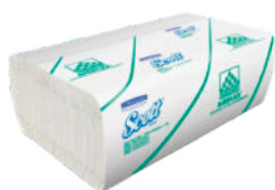
Servilleta SCOTT® MEGA AIRFLEX* Hoja Sencilla

Dispensada 1 a 1 Caja: 15 paq. x 200 hojas. Cod.: 30209703