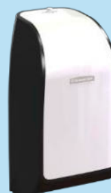
KCP DISP MOD BATH TISSUE FOLD W/B ABS 1X1

Presentación: Caja 36 paq. x 250 hojas. Cod.: 30179062