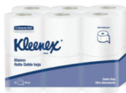
Pap. Hig. KLEENEX® Hoja Doble (4paqx12rollos)

Presentación: Plancha 48 rollos x 24 m. Cod.: 30205224