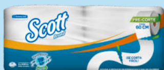
Pap. Hig. SCOTT® JRT 1P 4X1 X550