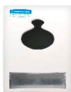
Disp. Servilleta POP UP Dispensada 1 a 1