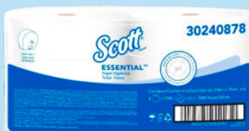
Pap. Hig. Scott Institucional JRT 2P CENTERPULL

Presentación: Plancha 48 rollos x 24 m. Cod.: 30205224