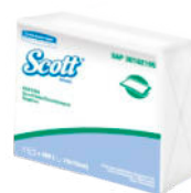
Servilleta SCOTT® Sencilla Hoja Sencilla

Plancha 16 paq. x 400 und. Cod. 30162105