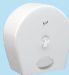
Dispensador PH Scott CENTERPULL

Presentación: Bolsa 6 rollos x 314 m. Cod.: 30240878