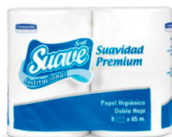
Pap. Hig. Suave Mini Jumbo 2 ply 1x8 x 65 m.

Presentación: Plancha 20 rollos x 16 m. Cod. 30229579