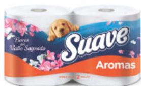
Pap. Hig. SUAVE 2P 10X2X16 AROMAS ARM

Presentación: Plancha 20 rollos x 16 m. Cod. 30229579