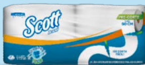
Pap. Hig. SCOTT® Institucional JRT Hoja Sencilla Super Economico