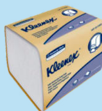
Pap. Hig. KLEENEX® Hoja Doble Dispensado 1 a 1 (Bulk Pack).

Presentación: Bolsa 8 rollos x 70 m. Cod.: 30220725