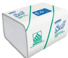
Servilleta SCOTT® POP UP AIRFLEX* Hoja Sencilla

Dispensada 1 a 1 Caja: 15 paq. x 200 hojas. Cod.: 30209703